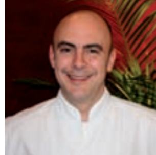
Koldo Rodero Restaurante Rodero Pamplona