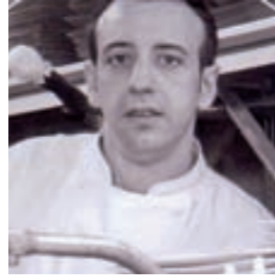
Orlando Tobajas Restaurante El Cachirulo Zaragoza