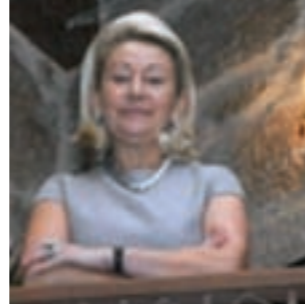
Charo Hotel Rural San Jaime Tibiás - Pereiro de Aguiar (Ourense)