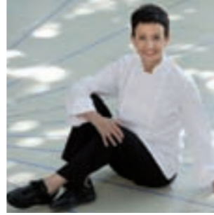
Carme Ruscalleda y Serra Restaurante Sant Pau Barcelona