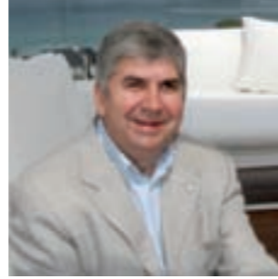
Restaurante Nito Viveiro (Lugo)