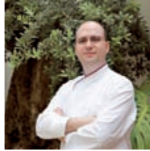
Rafael Carrillo Restaurante el Churrasco Córdoba