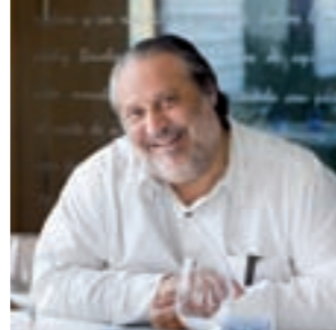
Manuel de la Osa Restaurante Las Rejas Cuenca