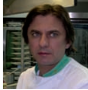
Ginés Navarro Restaurante del Parador de Cuenca Cuenca