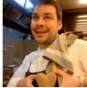
Sergi de Meià Restaurante Monvinic Barcelona