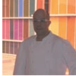
Javier F. Sevilla Restaurante Vivaldi León