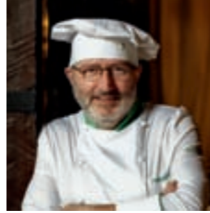
Iñaki Sardina Restaurante del Parador de Argómaniz País Vasco