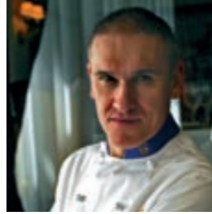
Pedro Salcedo Hotel Restaurante Juanito Jaén