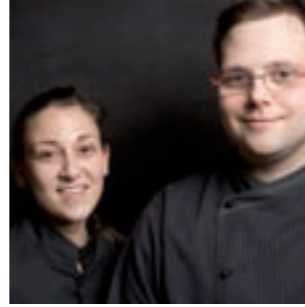
Retiro de la Costiña A Coruña