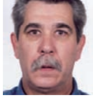
Rafael Medina Restaurante del Parador de Extremadura