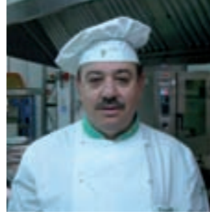
Rafael Nájera Restaurante del Parador de Olite Navarra